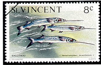
タイセイヨウサヨリ 1975

本州中部以南の温帯から熱帯海域の沿岸の内湾や河口に生息し、春から夏にかけて藻場で産卵する。卵は直径3mm位の大きさで、4～5本の短い粘着糸とこの反対側には長く太い粘着糸とがあって海藻にからみつく。下顎は口嘴状に延び、この先端は紅色で、上顎はさほど長くない。鱗は粗く大きい。産卵期には雌の方が大きい。雄は1～2年で成熟するが、雌は2年を要する。腹腔(腹の内側)は黒く、ハラグロとも呼ぶ。動物性プランクトンを捕食する。旬は春から秋にかけてで、寿司種、刺身として上品且つまた美味で、高級魚である。