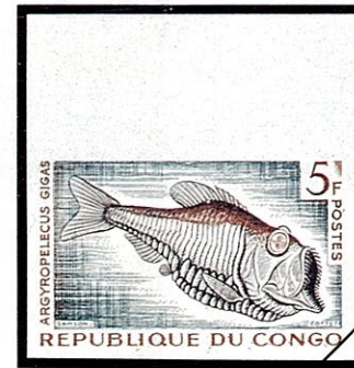
テンガンムネエソ Argyropelecus gigas

熱帯から温帯にかけての水深1,000～2,000mの深海に生息し、体長10cm以下の深海魚で、夜間は海面に浮上し、海辺に打寄せられることもある。体長に比して頭部が大きく、且つまた体高が高いため短く見え側扁している。口は大きく下顎に対して垂直に裂け、深海での少い獲物を見つけたとき確実に捕食できるよう、常に開いている。体色は銀色味をおび、両眼の間隔は狭く近接し上方に突出する。頭部と腹部には緑色の光を発する発光器があって、レンズ、フィルター、反射膜などをもち複雑な構造をしている。水深1,000m、水压100気圧、水温5℃の暗黒の海をさまよえるムネエソは、体も骨もやわらかく、よく高圧に耐えて、餌料の乏しい環境のもと、無駄なエネルギーを消費することなく、ひっそりと生きていることと考えられる。