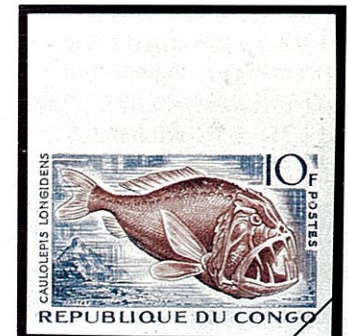
ムネエソの一種 Caulolepis longidens