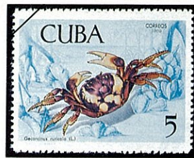
ムラサキオカガニの一種