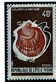
Chlamys flabellum ウチワニシキガイ