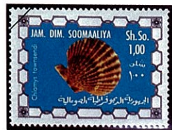
C. townsendi タウンゼントニシキ