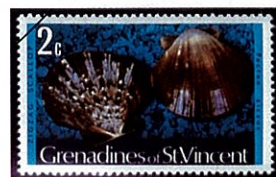
Pecten ziczac イナズマイタヤガイ