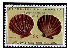
Chlamys nodosus コブナデシコ

樺太、千島、北海道、青森にかけての冷水域の小石混りの砂底の水深10~30mに生息する。殻はほぼ円形で、殻の合わせ目の部分に耳状の突起がある。左殻はやや平たく、右殻にはふくらみがある。殻の表面には放射状にのびた肋があって、肋の数は左の殻で13~31本、右殻で15~32本で、平均して各々20ないし22本である。二枚貝は巻貝と異なり、眼がないのが特徴であるが、ホタテガイ類には外套膜の縁に美しく青い玉のような眼や、糸のような触手の感覚器がみられる。同科のイタヤガイ ( Notovola albicans ) は殻の表面の放射肋が板ぶき屋根のようで、板屋貝とよばれ、肋の数は8~10本と少なく、分布域もやや南に偏する。イタヤガイ、ホタテガイ類にとってヒトデ類は大天敵である。