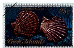
C. pallium チサラガイ