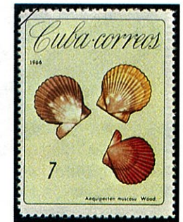
C. muscosus アザミヒヨク