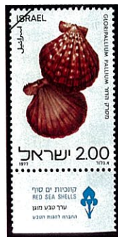
C. pallium チサラガイ