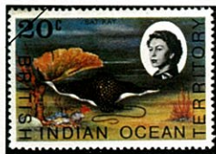
マダラトビエイ Aetobatus narinari