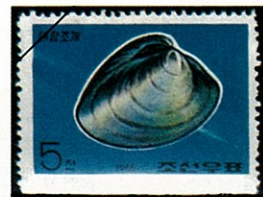
Mciretrix petechialis シナハマグリ