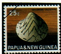
Lioconcha castrensis マルオミナエシガイ