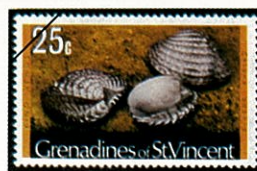
Chione pahia カノコアサの一種