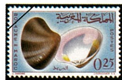
Pitaria chione ユウカゲハマグリ的一种