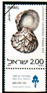
Lioconcha castrensis マルオミナエシガイ