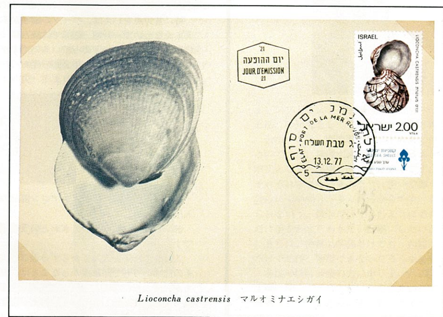
Lioconcha castrensis マルオミナエシガイ