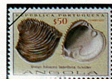
Venus foliace lamellasa