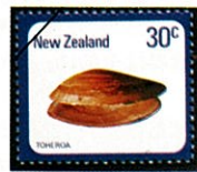
Pahia 属 スダレガイの一種

殻は小型から大型に及び、左右は等殻、長楕円形から卵円形及び円味をおびた三角形のいわゆるハマグリ形、殻頂は一般に良く発達して前方にやや傾いている。(殻頂が傾いている方が前縁にあたり、前縁側から足がのぞかれ、後方部背縁側から基部で融合した出入水管が見られる) 殻頂には柳葉形の小月面(前丘)及び楕面(後丘)がやや明らかで、前丘下方には前側歯と3本の主歯が左右殻片にあり、後方に外在する靱帯で結ばれる。食用にされるものが多く、砂泥地の潮間帯から10m以浅に生息する。