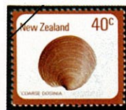
Phacosoma 属 カガミガイの一種