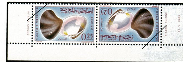
Pitaria chione ユウカゲハマグリ的一种