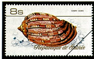
パライロショクコウラ H. doris