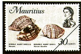
右 ミサカエショクコウラ 左 ウネショクコウラ