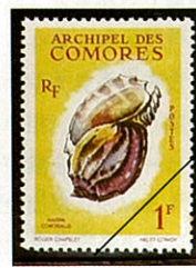
ウネショクコウラ