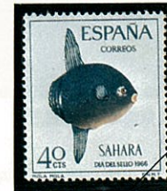
スペイン領サハラ -1966-