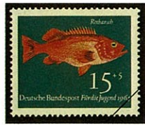
タイセイヨウアカウオ 西ドイツ Sebastes marinus -1964-