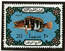
左端に同じ リベア -1975-