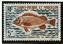
メバルの一種 サンピエール・ミクロン Sebastes -1972-