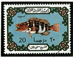
カサゴの一種 リベア -1974- Sebastes marmoratus