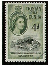
ケープメバル トリスタンダクーニャ島 Sebasticthys capensis -1960-

日本の中部以南即太平洋岸では房州以南、日本海側では富山県以西の暖海の岩場や岩礁に生息分布する。メバル属は30数種ほどあり、生息する水深により、体色が異なり水面から数mまでは黒褐色で深くなるにつれ茶色から赤色味が増してくる。体側にはあまりはっきりしない斑紋又は横縞が見られる。種名のメバルは浅い岩場に生息し茶色又は黒褐色をしている。同じ岩礁地帯にすむカサゴ Sebastes marmoratus は単独で腹を岩に接しているが、メバルは数尾から数十尾の群れでホンダワラ類の茂みの間で頭を上にして体を斜めにしてることが多い。これらの生態の相異は捕食の差異に因づくもので、メバルは海藻に付いているモエビやワレカラ類を捕食する。