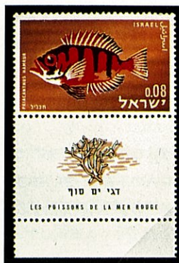
ハウセキキントキ イスラエル-1963-