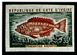
キントキダイの一種 コートジボアール P. arenatus -1973-