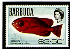
キントキダイの一種 バーブダ P. arenatus -1969-