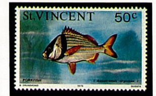
セント・ヴィンセント -1975-