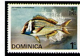
ドミニカ -1975- (学名は誤記されている)

大西洋西部のフロリダ半島からブラジル沿岸にかけての熱帯から亜熱帯海域にかけて分布し、大太平洋には生息しない。体色は玉虫色をおびた灰色で体長の側面には7本の黄色の縦縞が見られる。背鰭起部から胸鰭起部と眼を通り下顎に至る顕著なる黒縞があって他の種属との識別は容易である。幼魚の頭部はやや青白味をおび下顎から頑丈な棘の生えた背鰭起部にかけて黄色の縞が見られる、幼魚は他の魚に寄生して掃除屋の役割をする。体長30cmに達する。