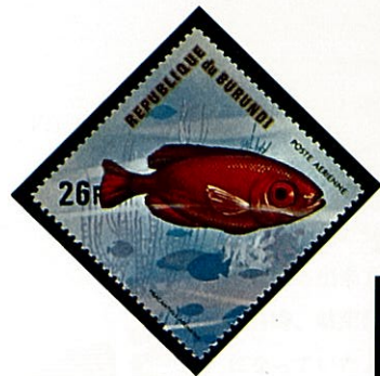
キントキダイの一種 ブルンジ P. arenatus -1974-