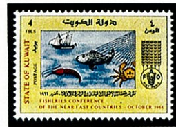
アカモンガニ クエート -1966-