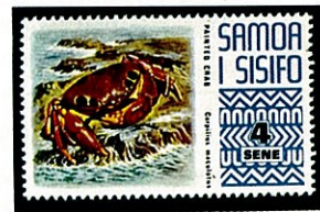
アカモンガニ サモア -1972-

熱帯から亜熱帯のハワイ諸島から太平洋、紅海、南アフリカにまで広く分布し、日本では紀伊半島、小笠原諸島、沖縄各地に生息する。甲長90mm、甲幅122mmの大型のカニで、淡紫紅色の甲面には11ヶの濃紅色の斑紋が左右対称に位置するので識別は容易である。右の鉗脚は頗る大きく掌部は特にふくらみが大きい。不動指の付根には白歯状の大型の歯があり可動指はやや小形の2つの歯が見られる。同属のユウモンガニ( C. convexus ) はアカモンガニよりやや小型で(甲長56mm、甲幅78mm)甲、鉗脚、歩脚共良く似ているが、甲面は濃チヨコレート色で、赤い斑紋はなく淡黄色の雲紋模様がある。分布域にほぼ同一である。