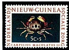
アカモンガニ オランダ領ニューギニア -1962-