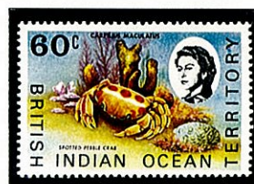
アカモンガニ 英領インド洋地域 -1970-