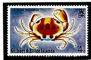
アカモンガニ ギルバート・エリス諸島 -1975-