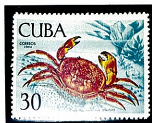
ユウモンガニ類 キューバ -1969-