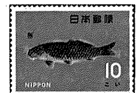
日本 - 1966