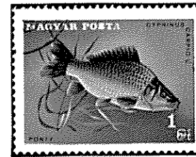
ハンガリー - 1967

鯉は中央アジアが原産地で、世界各地に分布している。変異性が強く、個体的に又地方的に多種多様な変異が見られる。野性種は一般に体高が低く、体幅が厚く、人は魚の成長が困難である。飼育種は種々の型があるが、ヤマトゴイは体高が高く、体色がやや淡い。ドイツゴイ(日本へ移殖されたのは1904年)はカワゴイ(革鯉)とカガミゴイ(鏡鯉)とが代表的で、前者は側線が無く、後者は側線が太く、鱗が粗い。