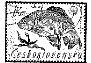
カガミゴイ チェコスロバキヤ - 1966