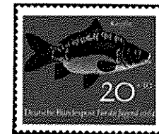
カガミゴイ 西ドイツ - 1964