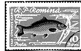
ルーマニア - 1960