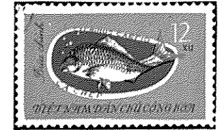
北グトナム - 1963