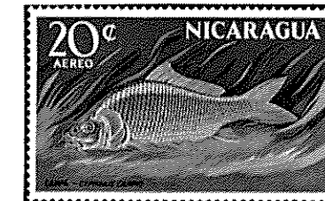
ニカラガ - 1969