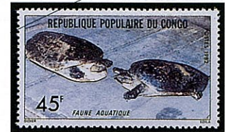
アフリカスッポン Trionyx