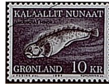
オオカミウオの一種 A. lupus