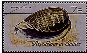
オオシマトリノコガイ M.strigata