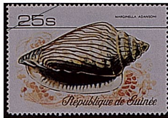
ハルサメヘリトリガイ M.adonsoni