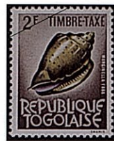
ゴマダラヘリトリガイ M.faba