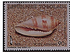
シラボシヘリトリガイ