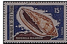
シラボシヘリトリガイ

一般に殻は小型で強靱、7mm～50mm位で普通25mm前後のものが多い。殻表はタカラガイに比較される位滑らか、螺塔は低い、殻口の軸唇に4ヶ以上のヒダがある、蓋はない。本種はコートジボアール（アフリカ西海岸）に分布し、沖合の100m位の砂底に生息するが稀種である。体高50mm。