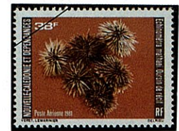
ナガウニ Echinometra mathaei