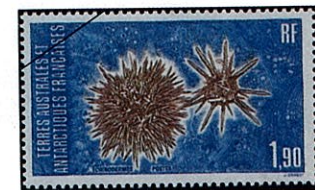
左 ナガウニ 右 マツカサウニ