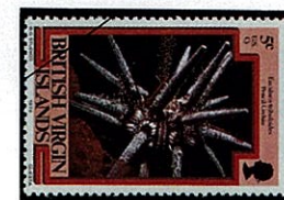
マツカサウニの一種 Eucidaris tribuloides