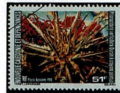
ノコギリウニの一種 Pr. verticillata

相模湾以南の暖海の浅海から水深250m位に広く分布する。絶滅した化石の現存種というべきもので、ウニの原始的特徴をもっている。殻の直径5cm、高さ3cm、殻の両面はやや平たく、大きなイボが縦に一列に並び、その頂点には関節で連結された大棘はやや偏平、又は円柱状で長さは10cm、先端はやや鋭い、大棘の根元は環溝の周りに生えた短い棘に包まれ、赤褐色の丸い小斑点が並び、その上方に鋸歯状に棘と顕著な赤褐色、又は赤紫色の横縞が見られる。同科のマツカサウニ、 Eucidaris metularia は殻の直径2cm位で陣笠の様な形をして、大棘の先端は丸みをおびている。