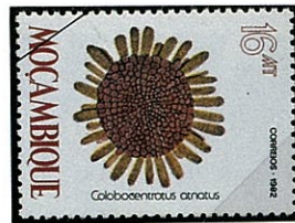
ミナミジンガサウニ Colobocentrotus atratus