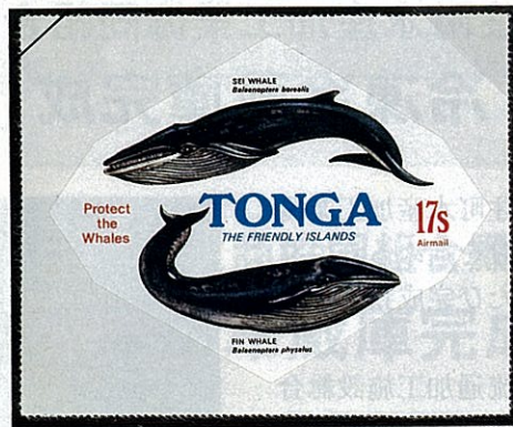
上 イワシクジラ 下 ナガスクジラ Balaenoptera physalus

北太平洋、北大西洋及南水洋に分布し、冬期に暖海で出産交尾を行なうことは他の種と同様である。体形はほっそりした紡錘形で、背鰭は大きく高く、畝は60～65本でへそまでは達しない。体色は背部は黒く腹部は白いがその中間はぼかし模様となっている。鯨ひげはひげ板が黒色で、せん毛は白色。胸鰭は小さい。胸鰭と尾鰭の裏側はネズミ色で、ナガスクジラ B. physalus は白色であるので、他種との識別の決め手になっている。本種はその名の示すが如く、イワシ、サンマ、コウナゴ、ニシン、タラ、ホッケなどを捕食するが主としてオキアミ、カラヌスなどの小甲殻類を好んで食べる。体長は北半球産のものは雄13.5m、雌14.4mで、南半球のものは0.9m程大きい。