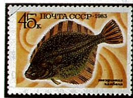
P. flesus ヌマガレイの一種