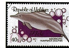
インドウスイロイルカ S. lentiginosa

アフリカ西海岸、セネガルからカメルーンにかけての沿岸域に生息する。体形は太めの紡錘形で嘴が長く眼から吻端までの長さは体長の1/3にたつする、背鰭は体の中央にあって、基部が長く先端はとがり後縁は略々円形にくぼむ。背鰭附近の体高が最も高い。胸鰭は先端がとがり後方になびく。体色は背部が鉛色又は灰色で腹部は更に淡色となってくる。噴気孔は体外に筒状に小さく突出する。体長2.3m、体重140kg、英名の由来する歯の数については詳細不明、習慣その他不詳。