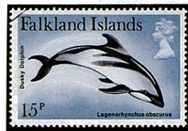
ハラジロカマイルカ

北大西洋にのみ分布し、デービス海峡、ノルウェー北部、ニューファンドランド島近海に生息する、太めの紡錘形でカマイルカ属 ( Lagenorhynchus sp. ) の典型的な体形で、大きな鎌状の背鰭は体中央にあって、胸鰭は先のとがった三角形、尾部の稜状の皮膚の高まりは上下共いちじるしい。体色は背部が黒色、腹部は白色なるも、白い部分は少い。嘴の上表面が白く極めて顕著である。歯は上下共52~54本。イカ、タコ、コダラ、ニシン等を捕食する。寒海に適応して脂皮は厚い。体長3m。同属のハラジロカマイルカ L. obscurus はフォークランド島近海、ニュージーランド近海に生息する。