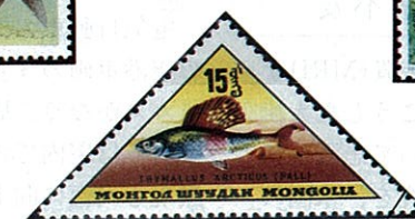
バイカルニシウオノハナ