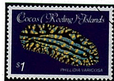
Phyllidia varicosa キイロイボウミウシの一種