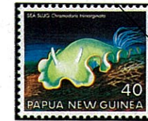
Chromodoris trimarginata シロウミウシの一種