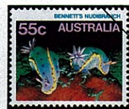
Chromodoris sp シロウミウシの一種