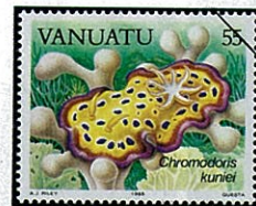
Chromodoris kuniei シラライロウミウシの一種