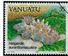
Halgerda aurantiomaculata ニクイロウミウシの一種