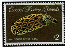
Halgerda tessellata ニクイロウミウシの一種

本州以南の暖海に広く分布する。体全体は一般にナメクジ状で触角は大きく広がる。体長3~10cm位、体表にはイボ状、羽状、乳頭状の突起があり、体側の縁は波うつ、体色は頗る派手で多彩。巻貝の一種で貝殻から解放され、ねじれた体形から左右対称へと進化したものである。鰓が心臓より後方背部にあたるため後鰓類と呼ばれるが、鰓は殆ど退化して、二次的な偽の鰓が体表にあるものが多い。海底のみならず、ヤギ：Gorgonaceaの枝の上を這ったりしているのは、これらのポリプを食べているのであろう。生活史、食性、分類学的位置付等未知の点が多い。