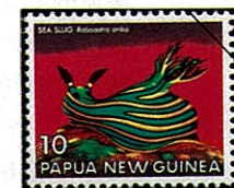
Nembrotha sp イシガキリュウグウウミウシの一種