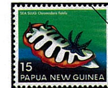
Chromodoris fidelis シロウミウシの一種