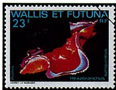
Hexabranchius sanguineus ミカドウミウシ