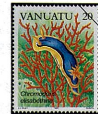
Chromodoris elisabethina シロウミの一種