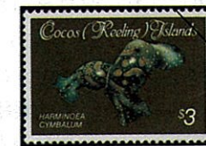
Harminoeu cymbalum リュウグウウミウシの一種