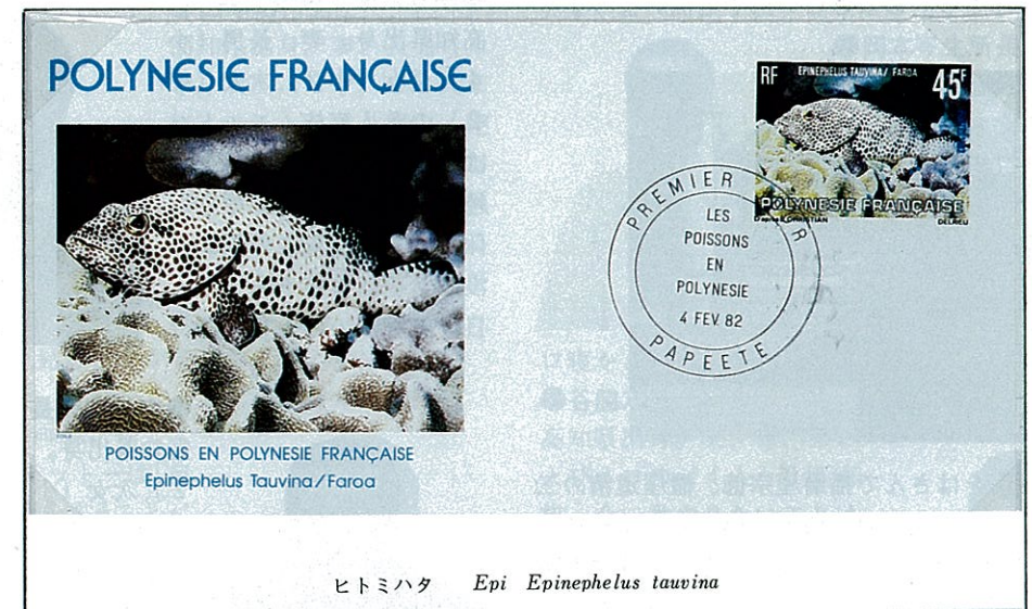
ヒトミハタ Epi Epinephelus tauvina