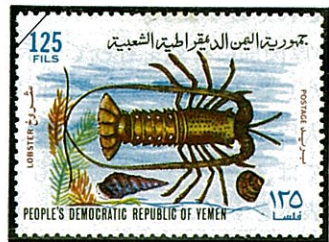
ケブカイセエビ P. homarus