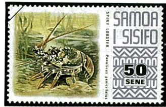
シマイセエビ P. penicillatus