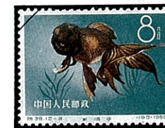
紫オランダシシガシラ