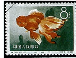
オランダシシガシラ