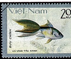
チンウエンユウイ(青文魚)