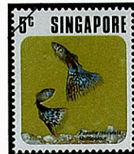
モザイクファンテールグッピー