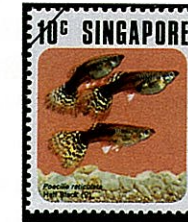
モザイクデルターテールグッピー