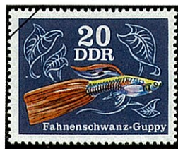
レッドファンテールグッピー