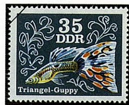
デルタモザイクグッピー