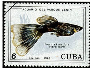
ブラックファンテールグッピー