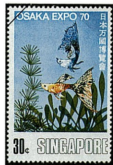
モザイクデルターテールグッピー