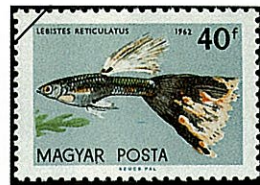
ブラックファンテールグッピー