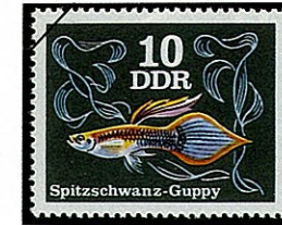
ニードルグッピー