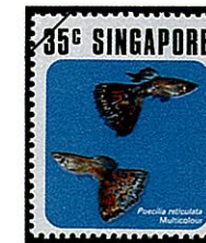
モザイクファンテールグッピー