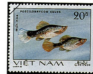
ブループラティ Xiphophorus maculatus