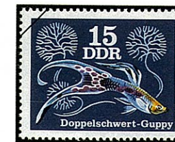
ライアテールグッピー