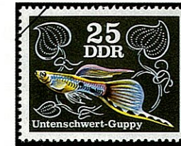
ソードテールグッピー