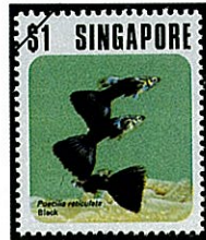
ブラックテールタキシード

中南米が原産地で、カリブ海や南米北部の淡水域では普通に見られ、雄の大きな尾鱗は赤、橙、黄緑、青、紫等、種々の美しい艶やかな色模様に彩られる。体長は尾鱗を除けば3cm程で、雌の体長は雄のその2倍以上になる。多産で成熟が早く、生息水温が5℃～38℃と極めて広温帯であること、汚水中でも生息出来ること、食性が極めて雑食性であること、病気に罹り難いことなど種々の特性のため、観賞魚としてのみならず、各種の実験研究にも用いられている。食餌は藻類、水生昆虫、魚の卵などの他、ボウフラが好物で、東南アジアではマラリアの駆除に移植利用されている。