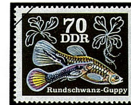
ラウンドテールグッピー