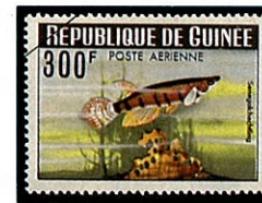
シックスバンド・パンチャックス