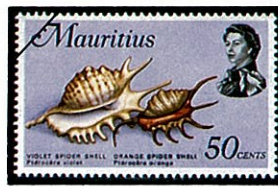
ムラサキムカデサソリガイ L. violacea