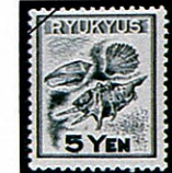
上から リュウキュウオウギ Chamys radula マガキガイ Strombus luhuanus クモガイ Lambis lambis