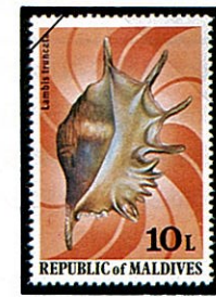
ラクダガイ Lambis truncata