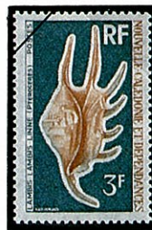
クモガイ L. lambis