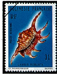
オニサソリガイ L. robusta