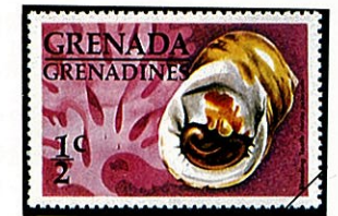
チダシ アマオブネ