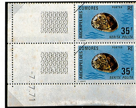
ニシキ アマオブネ