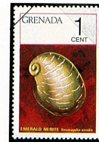
エメラルドカノコ Smaragdia viridis