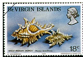
コボネテングガイ