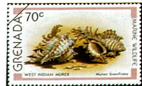
コボネテングガイ