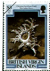
コボネテングガイ