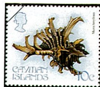
コボネテングガイ