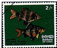
ブラックルビー B. nigrofasciatus