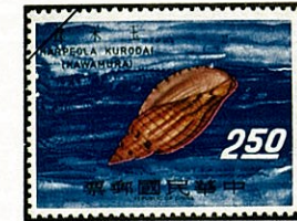
アデヤカ スノコ ボラ Lyria kurodai