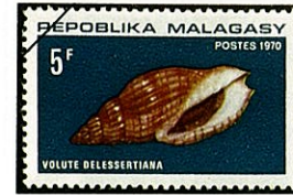
キサキ スジ ボラ Lyria delessertiana