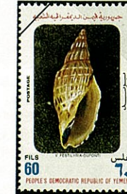
デュボン ゴクラク ボラ Alcithoe duponti