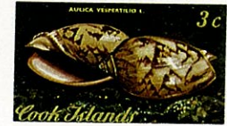
トウ コオロギ Cymbium vespertili