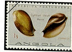
オミナ ハッカイ Cymbium cisium