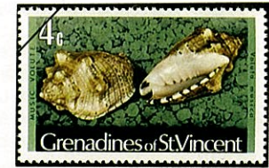
ガクフ ボラ Voluta musica