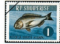
ヨーロッパダイ ヘダイ亜科 Sparus auratus