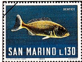
ナミレンコ Dentex maroccanus

北西アフリカ沿岸及び紅海から南アフリカにかけての印度洋に分布する。体型は細長い楕円形で強く側扁する。両眼の間即眼隔域は、僅かに隆起する。頭の鱗が眼隔域の中央まで伸び、前鰓蓋骨後部の下半部には鱗が全く見られないこと及び、背鰭第3、4両棘が長く糸状に後方に伸びることなどで他種と識別される。体色は桃色で、側線上方には背縁に平行、また側線下方では体軸に平行なる黄色縦線が見られる。同亜科のDentex 属は、前鰓蓋骨後部下半部が鱗で被われ、背鰭の棘は糸状に伸びない。