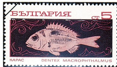
オオメレンコ Dentex macrophthalmus