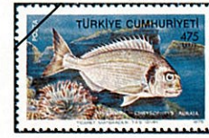
ヨーロッパヘダイ ヘダイ亜科 Sparus auratus