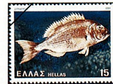
スペインダイ ヨーロッパダイ亜科 Pagellus bogaravoo