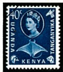
イトマキエイ(マンタ)