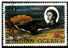
マダラトビエイ Aetobatus narinari