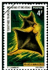
イトマキエイ(マンタ) Manta brevirostris