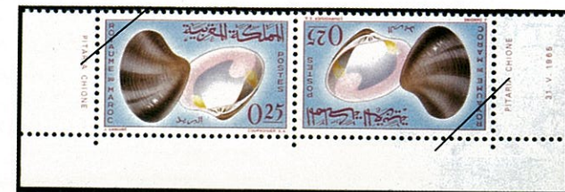
Pitaria chione ユウカゲハマグリ的一种