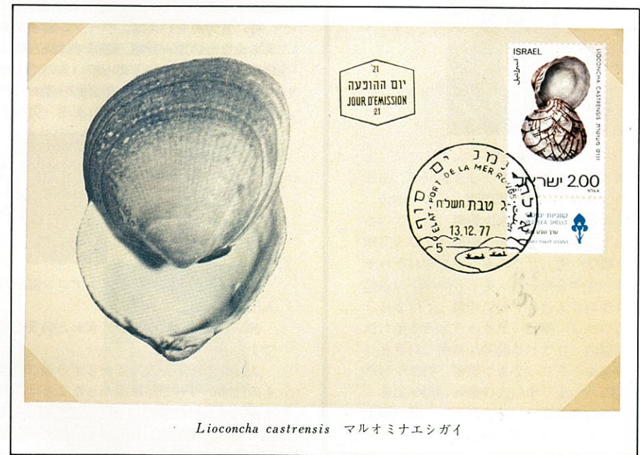
Lioconcha castrensis マルオミナエシガイ