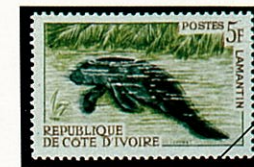
コートジボアール -1964-