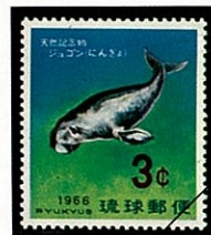
沖 縄 -1966-