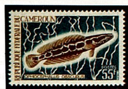
アフリカドジョウ カメルーン -1968-