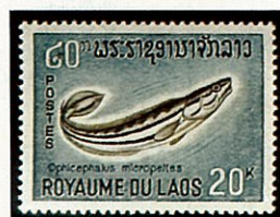
タイワンドジョウの一種 ラオス -1967-