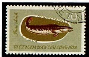
タイワンドジョウ 北ヴェトナム -1963-

アジアとアフリカの亜熱帯から熱帯地方の淡水域に各1属が分布し、流れのない浅い池や沼などに生息する。タイワン、海南島を原産地とするアジア種は大正五年に日本に持ち帰ったものが繁殖したもので、タイワンではライヒーと呼んでいる。近似種のカムルチー (C. argus) はアジア大陸東部の揚子江付近からアムール河及朝鮮半島に分布し、両者の区別は体側のニシキヘビのような斑紋が前者では縦に3列、後者では縦に2列であるので外観より判別し得る。大きな鰓の外に上鰓器官があり空気呼吸をする。小魚・ザリガニ・カエルなどを捕食する害魚であるが肉は美味である。西アフリカの象牙海岸の淡水域に生息するアフリカドジョウ (Parophiocephalus obscurus) も本科に属し体長1mに達する。