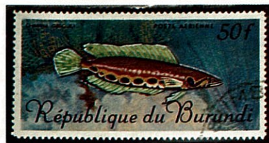
アフリカドジョウ ブルンジ -1967-