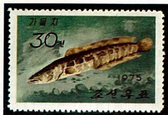
カムルチー 北朝鮮 -1975-