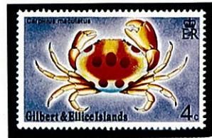
アカモンガニ ギルバート・エリス諸島 -1975-