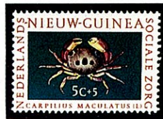
アカモンガニ オランダ領ニューギニア -1962-