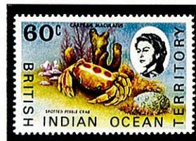
アカモンガニ 英領インド洋地域 -1970-