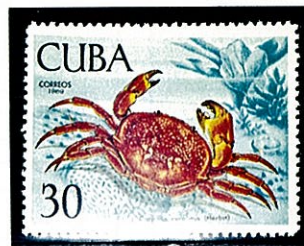
ユウモンガニ類 キューバ -1969-