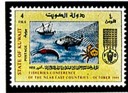
アカモンガニ クエート -1966-