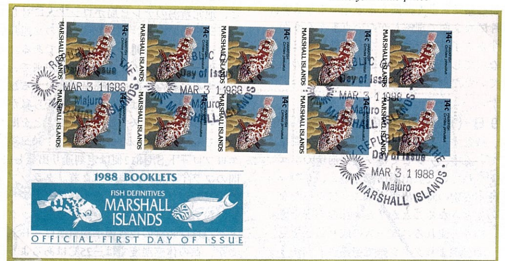
クロホシゴンベの一種 Amblycirrhitus pinos