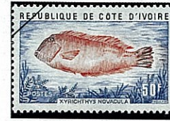
ヒラベラの種類 Xyrichtys novacula