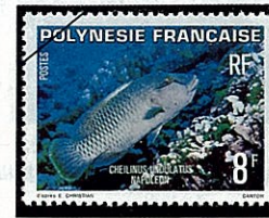
メガネモチノウオ Cheilinus undulatus