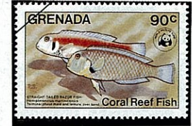
ヒラベラの種類 Xyrichtys martinicensis