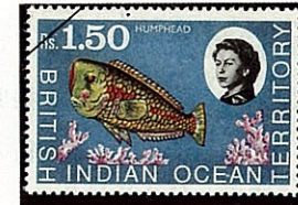
ヒラベラの種類 Xyrichtys sp