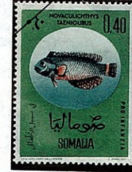
オヒテンスモドキ Novaculichthys taeniourus