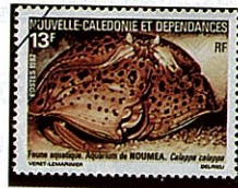
マルソデカラッパ