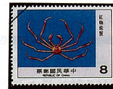
ヒラアシクモガニ(クモガニ科) Platymaia alcocki

紀州南岸から沖縄、台湾、東南アジア、オーストラリア及びインドからモーリシャスにかけて分布するが、日本では稀である。甲は横楕円形、鉗脚は極めて長く甲長の約4倍程あって長節及び掌節が特に長い。前後縁、上下面共に大小の鋭い棘に被われている。歩脚は短く細い。甲面及び鉗脚には顆粒が見られるが何れも先端が鋭く尖る。