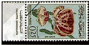
カラッパの一種 C. granulata

カラッパ類の内でも大きく甲長は、72mm、甲巾は124mm位、相模湾から紀伊半島、奄美大島、ハワイ諸島、太平洋温帯熱帯海域及びインド洋熱帯海域にかけて広く分布する。カラッパ類は甲の中心から後側縁にかけてひさし状に広がり大きく甲面から張り出すが、カラッパ属 (Gen Calappa) の中で本種が最も良く発達している。歩脚はこの甲面の張り出した部分にたたみこむことが出来るが、夜間には後方にいざるように移動しながら、大きく巾の広い頑丈な鉗脚で二枚貝の貝殻を割って食べる。昼間は砂の中に眼だけ出して浅く潜っていることが多い。甲面の色は全体的に淡橙色又は淡褐色のものと、甲面に黒紫色の大小の斑紋のあるものがある。甲面及び歩脚共殆ど毛がない。