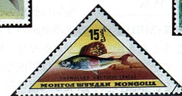
バイカルニシウオノハナ