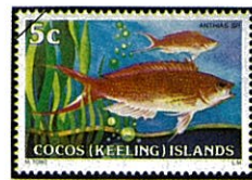
オオテンハナダイ Pseudanthias smithvanigi

ハナダイ類は同一種でも雄と雌とで形態、色彩が異なる上、性転換をするので分類学的にも生態学的にも不明な点が多く、十分に解明されていない。