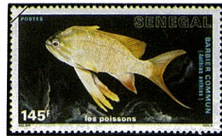
ハナダイの一種 Anthias anthias