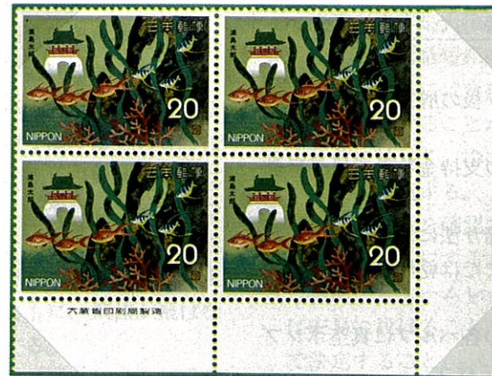
サクラダイ Sacwa margaritacea