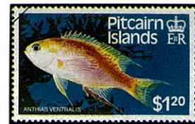
ハナダイの一種 Anthias ventralis