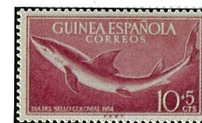
ヨシキリザメ スペイン領ギニア 1954