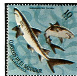
メジロザメ サルバドル 1971