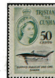
ヨシキリザメ トリスダグンワ 1961