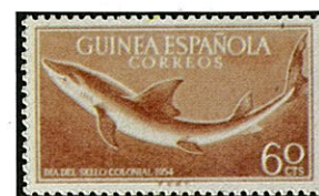
ヨシキリザメ スペイン領ギニア 1954

全世界、温帯から熱帯にかけて分布し、日本近海ではサメ類中で最も多い種属がアル。性質共に鱗鱗且経集が、海表面層及び中層の近遊泳シ水中に人間ヲ獲ウコトガアル。眼ハ瞬膜アリ、魚眼ノ如ク裂ガ、胸鰭前縁1対ヲ根ト交叉スル。鰭ハ中華料理ノ"カビレノス"ノ材料トナルガ、ヨシキリノスハメジロノスノ類アル。